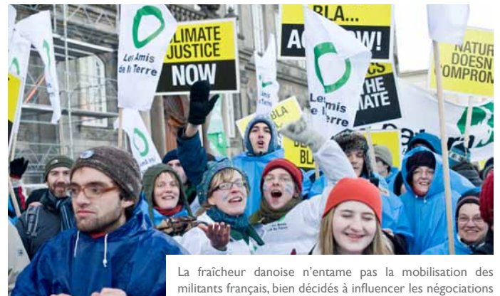
La fraîcheur danoise n'entame pas la mobilisation des militants français, bien décidés à influencer les négociations

Plusieurs dizaines de milliers de personnes nous ont rejoint devant le parlement pour la grande marche internationale de l'après-midi jusqu'au Bella Center, le lieu des négociations. Cette marche pour la justice climatique rassemblait ONG écologiques et altermondialistes (Via Campesina, Greenpeace, Oxfam, Friends of the Earth, etc.), des syndicats, des partis politiques, etc.