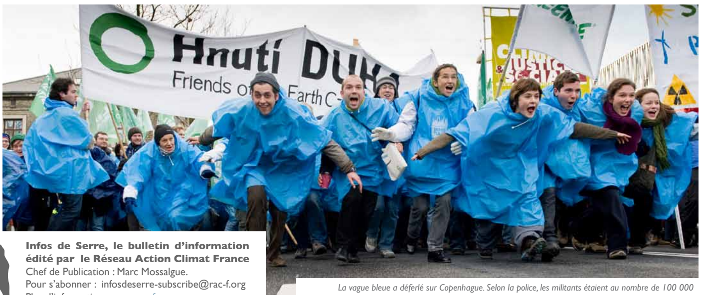
La vague bleue a déferlé sur Copenhague. Selon la police, les militants étaient au nombre de 100 000

Pour décider de la suite de la mobilisation, le collectif UCJS (Urgence Climatique Justice Sociale) organise une rencontre nationale le 6 février à Paris. La mobilisation populaire ne peut pas faiblir maintenant, alors que nous n'avons rien obtenu à Copenhague ! Pour suivre les futures mobilisations, rendez-vous sur le site : www.dubruitpourleclimat.org