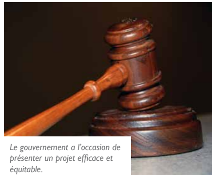
Le gouvernement a l'occasion de présenter un projet efficace et équitable.

Lors de l'élaboration de la taxe carbone, le Réseau Action Climat s'est insurgé contre les multiples exemptions instaurées par le gouvernement et le Parlement. Nous avons souligné la perte d'efficacité entraînée par ces exemptions, mais aussi le risque de censure par le Conseil Constitutionnel. Suite à cette censure, le gouvernement doit aujourd'hui présenter un nouveau projet abandonnant les multiples exemptions qui ont justifié la décision du Conseil Constitutionnel et revenir aux propositions du rapport « Rocard ».