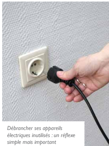
Débrancher ses appareils électriques inutilisés : un réflexe simple mais important

Le système électrique français, déjà fortement producteur de déchets radioactifs, a aussi pour grave défaut d'être particulièrement défavorable au climat lors des pointes de consommation électrique comme celles que notre pays connaît en ce moment. C'est ce constat désormais récurrent à l'époque des grands froids qui amène les associations à lancer un appel solennel aux pouvoirs publics et aux français à agir en faveur de la sobriété énergétique.